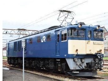
EF64形電気機関車 （自動連結器）