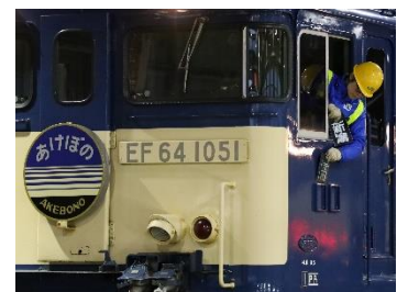
区名札差替えの様子