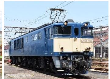
EF64形電気機関車 （双頭連結器）