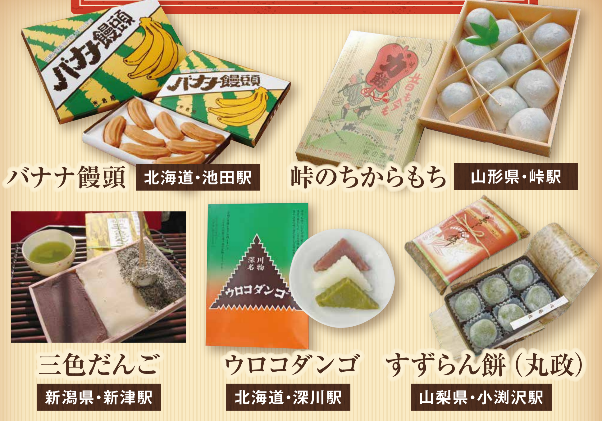
バナナ饅頭 北海道・池田駅