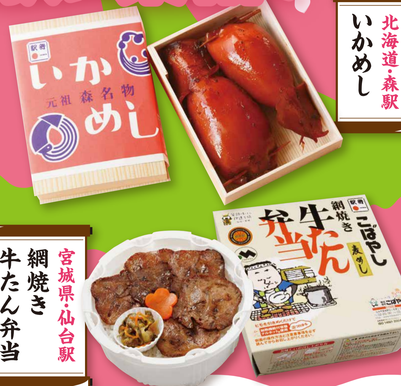
北海道・森駅 いかめし