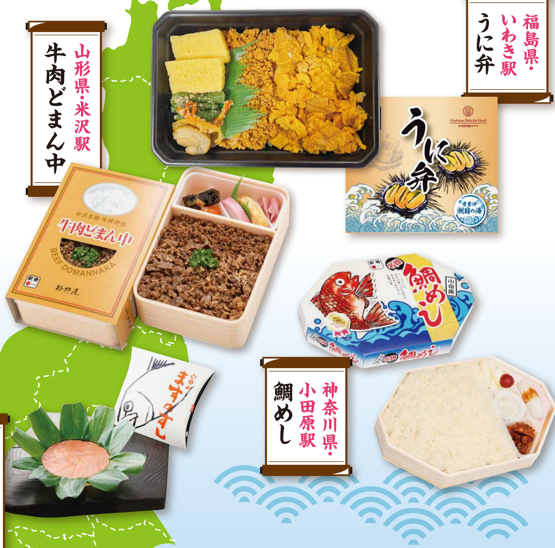
福島県・いわき駅 うに弁