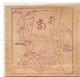
明治時代の掛紙 (京都鉄道博物館所蔵)