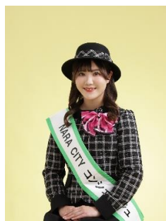
【第4代 NARA CITY コンシェルジュ】