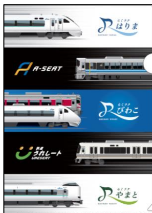
新大阪駅 19:43 発（奈良行き）