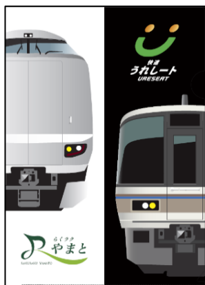
奈良駅 7:16 発（新大阪行き）

当日は、奈良駅発、新大阪駅発それぞれの列車にご乗車のお客様に、オリジナルクリアファイル(非売品：奈良駅発と新大阪駅発でそれデザインが異なります)をプレゼントします*。