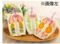
「フルーツスペシャル(いちご)」 サンドイッチハウス メルヘン