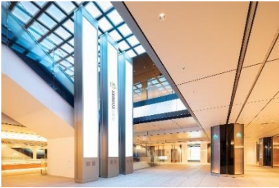
イベントスペース「スクエア ゼロ」

「グランスタ東京」は、「TRY NEW TOKYO ST.」(トライニュートーキョーステーション)をコンセプトとして、エキナカ初登場のショップや駅機能の拡充により、今までにないエキナカ空間を創造します。東京駅利用者のニーズを満たすことを超えた、新たな出会いや発見を創出することにより、今までのエキナカ概念を超える新体験を提供します。