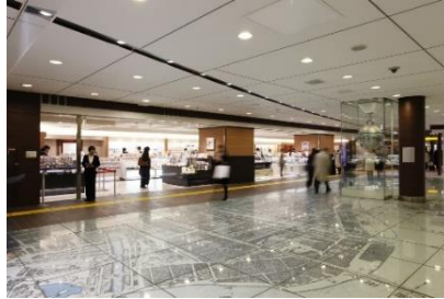
限定商品や限定ショップが並ぶ「銀の鈴エリア」