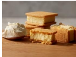
「チーズケーキサンド」 Now on Cheese♪