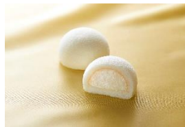
「萩の調 煌」 菓匠三全