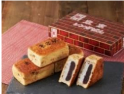
「東京レングアパン」 東京あんぱん豆一豆