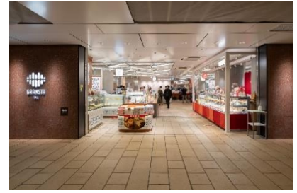
スイーツ・デリが揃う「京葉ストリートエリア」