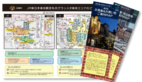
パンフレットイメージ