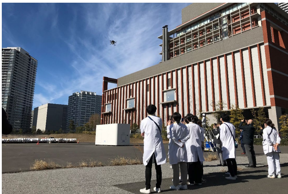
病院関係者の方々に本実証を視察いただいている様子