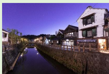
小野川の町並み(香取市)