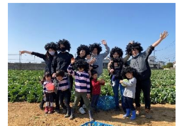
キャベツ収穫体験