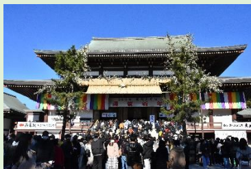
成田山新勝寺(成田市)