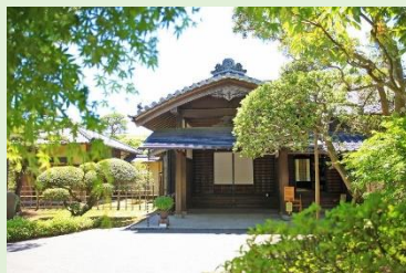
旧堀田家住宅(佐倉市)

今も残るその歴史的な町並みは2016年に日本遺産に認定され、「世界から一番近い江戸」として注目されています。