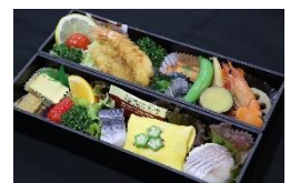
おつまみ弁当(イメージ)

【申込先】 https://www.jreastmall.com/shop/c/cl6/ (JRE MALL 千葉支社店)