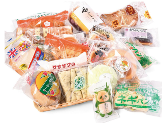
イギリストースト（青森県） 昆布パン（富山県）など