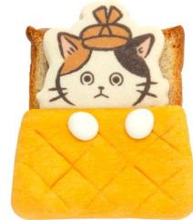
おふとんパンラスク 【NewDays 川口中央】