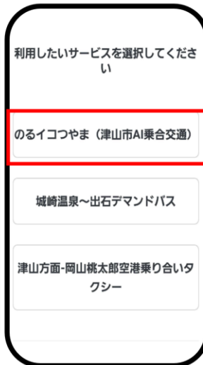
「のるイコつやま(津山市AI乗合交通)」を選ぶ