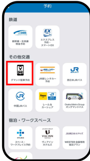
「デマンド配車予約」を押す