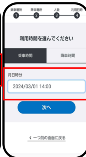
乗車日、利用時間を入力