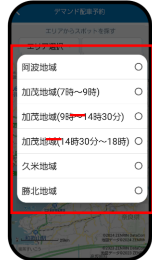
利用したい地域を選ぶ