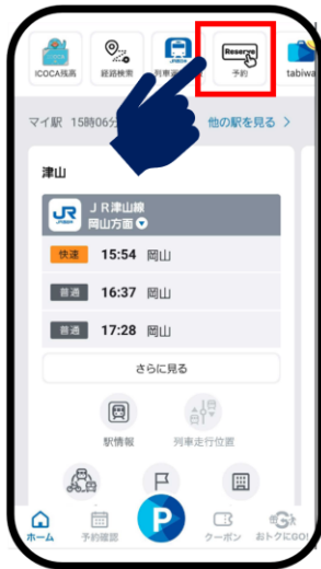
「WESTER」のホーム画面 「予約」を押す