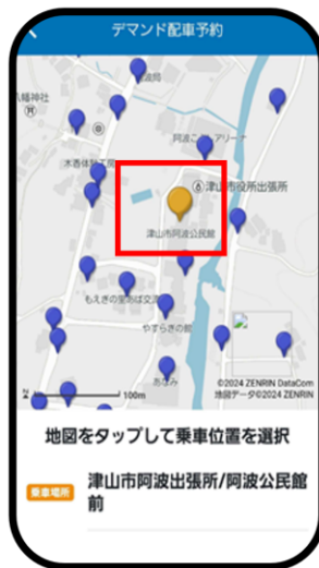
乗車場所、降車場所を選ぶ