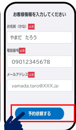
名前(かな)、電話番号、メールアドレス 入力し「予約依頼する」を押す