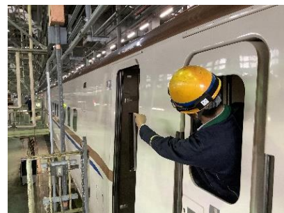
ドアの開閉テスト