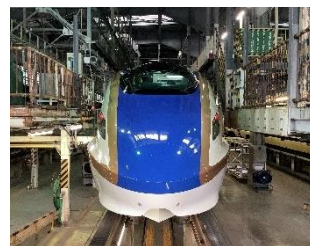
記念撮影スポットイメージ