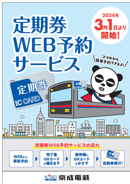
告知ポスター ビジュアル

※PASMOは、株式会社パスモの登録商標です。 ※QRコードは株式会社デンソーウェーブの登録商標です