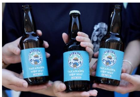
【TAKANAWA HOP WAYイメージ】

本イベントでは、実際に高輪エリアで収穫したホップに、地域の皆さまと収穫した高輪産はちみつを加えたオリジナルビールを数量限定で販売します。地産地消の希少なクラフトビールをぜひStation Parkでお楽しみください。