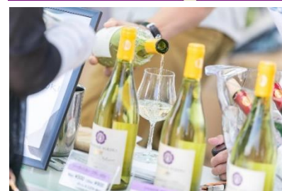
【ワインスタンドイメージ】