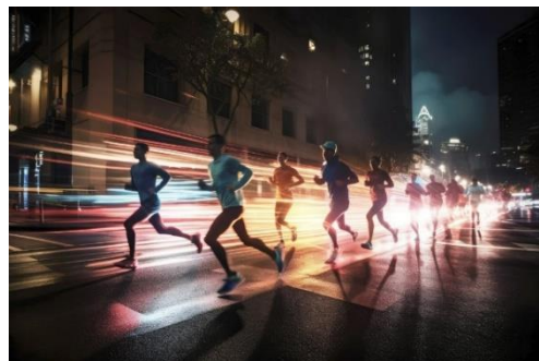
【ナイトランイメージ】