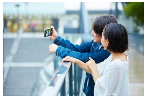
【フォトウォーキングイメージ】