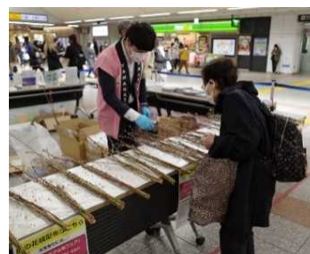
「桃の花枝」プレゼント(イメージ)

日 時：2月29日(木)・3月1日(金) 11:00~15:00 場 所：八王子駅改札外コンコース