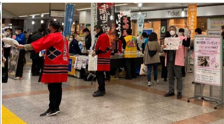
パンフレット配布・観光 PR