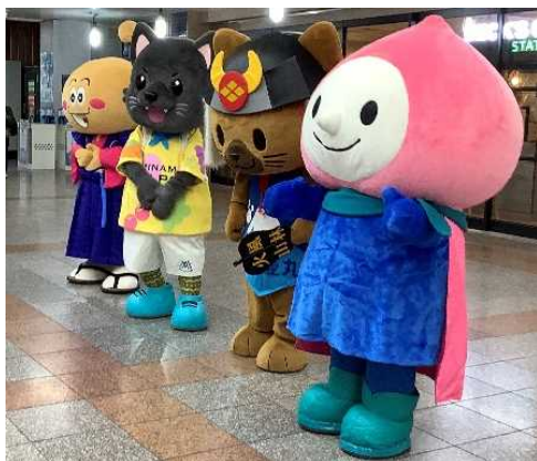
ご当地キャラクターによる観光 PR