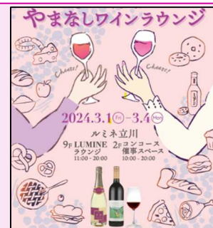
ポスタービジュアル

3月1日(金)～4日(月)までLUMINE 立川 コンコース催事スペース及び9F ルミネラウンジにて「やまなしワインラウンジ」が開催されます。立川駅周辺店舗の美味しいお惣菜を食べながら、やまなしワインを嗜み、ワインについて学ぶことができる貴重な機会です。是非やまなしの美味しいワインへ出会いに、LUMINE 立川「やまなしワインラウンジ」へお誘いあわせの上、お出かけください。