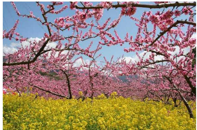
桃の花と菜の花（笛吹市）