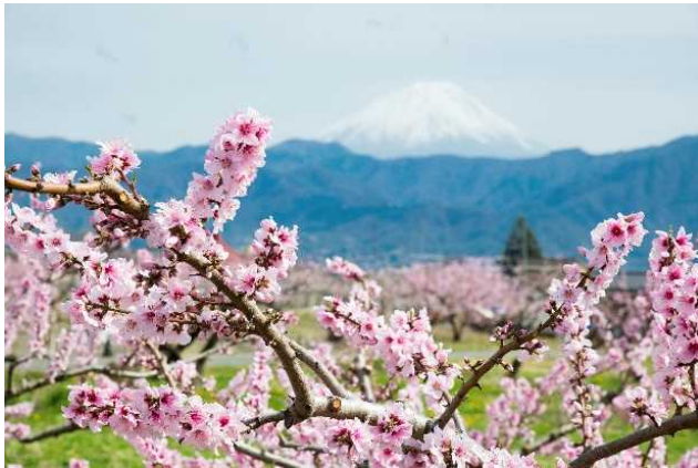
桃の花と富士山（南アルプス市）