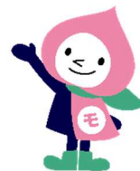
JRの山梨キャラクター 「ももすきん」