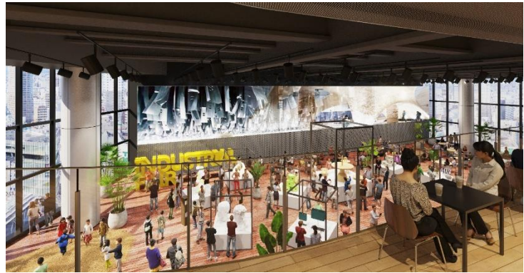
計画建物のイメージ