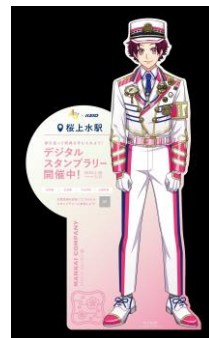
《等身大キャラクターパネル例》

京王線の府中駅や井の頭線の下北沢駅など、京王線・井の頭線の全5駅のラリースポットを巡り、専用サイト、もしくはラリースポットに掲出している二次元コードからアクセスしてサイト内の「スタンプを押す」ボタンを押し、位置情報を認証することでスタンプを集めるものです。なお、桜上水駅、府中駅、渋谷駅、永福町駅にはキャラクターの等身大パネルを設置します。