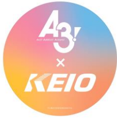
《ヘッドマーク (イメージ)》