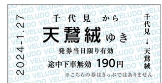
《「天鷲絨駅行き」レプリカきっぷ》