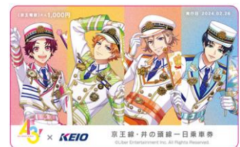
《京王線・井の頭線一日乗車券》