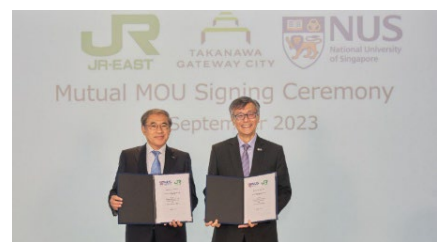
<覚書締結式の様子>

2023年9月、JR 東日本とシンガポール国立大学との間で日本とシンガポールを中心とした東南アジア地域におけるスタートアップエコシステムの構築に向け、覚書を締結しています。「TAKANAWA GATEWAY CITY」を拠点として相互に有益なパートナーシップと新たな国際交流の場を築くとともに、JR 東日本の多様なフィールドを活用し、スタートアップの技術や様々な課題解決に向けた実証実験の機会を創出します。