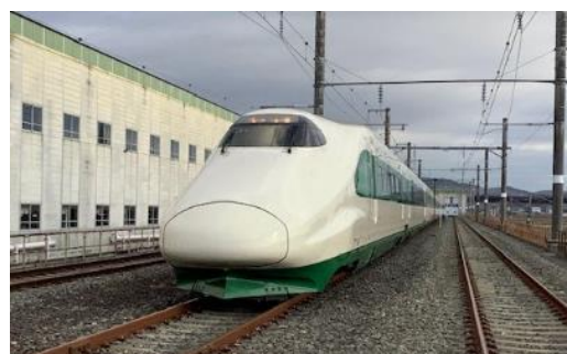
撮影イメージ （2023年1月12日8時40分頃撮影）