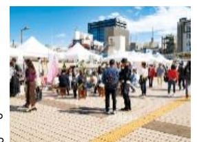
パンダバシピクニック(イメージ)