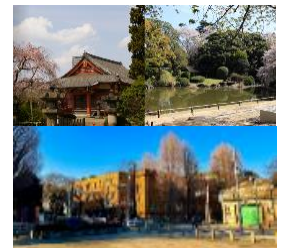
上野アートクロスまちあるき(イメージ)