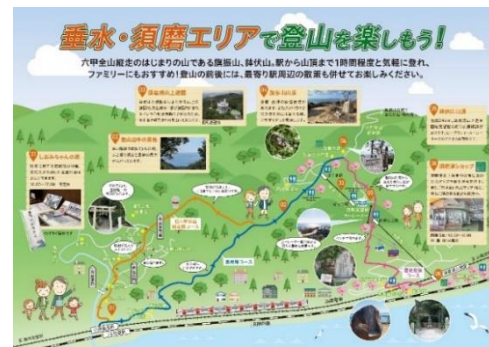
旗振山・鉢伏山周辺マップチラシ