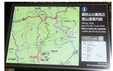
登山道案内板の整備(イメージ)

登山道の老朽危険等家屋対策、案内板の整備、登山道の整備・維持、新たな魅力の創出など、六甲山系中西部エリアを含む同プロジェクトへの支援を目的として100万円の寄附を行いました。