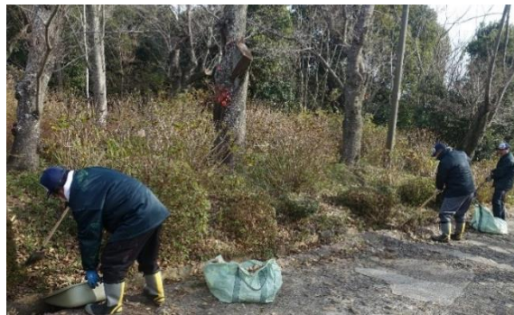
登山道維持活動（清掃活動）

須磨浦ロープウェイ鉢伏山上駅～旗振山～花の広場間のわき道を含む登山道で、当社係員とボランティアが登山道の清掃等の維持活動を行います。