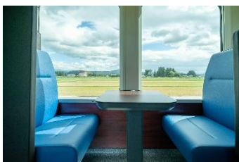
4人掛けボックスシート