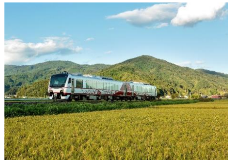
観光列車「ひなび（陽旅）」