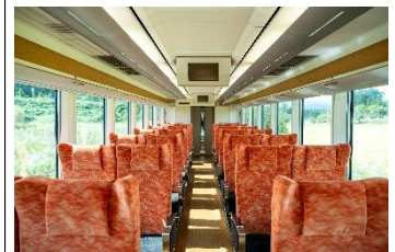
リクライニングシート