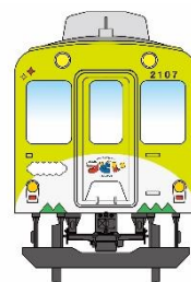
車両正面イメージ