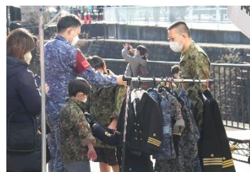
《子供用制服試着体験》