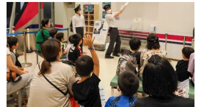
《お仕事紹介 (イメージ)》