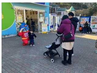
《キャラクターグリーティング》