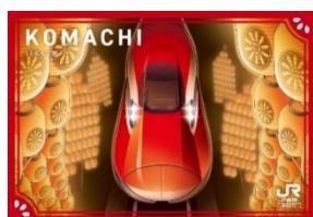
秋田駅カード イメージ