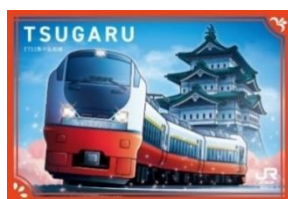
弘前駅カード イメージ