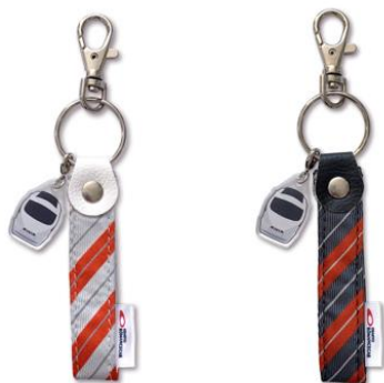
アップサイクルキーホルダー (左)シルバー (右)チャコール

小田急電鉄株式会社（本社：東京都新宿区 社長：星野 晃司）は2024年1月15日（月）から地域密着型サービスプラットフォーム「小田急 ONE（オーネ）」にて、現在は運用を終了しているロマンスカー乗務員の専用制服のうちネクタイを「アップサイクルキーホルダー」に、未使用生地※を「お子さま用レプリカ特急制服セット」にアップサイクルして、それぞれ数量限定で販売します。