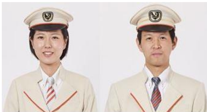
ロマンスカー乗務員専用制服のネクタイ (左)シルバー (右)チャコール

当社では、使用済みの制服について、破損状態などに鑑み基本的には原材料まで加工してリサイクルをする、もしくは、それが難しいものとして金具の付いたネクタイなどは焼却処分してまいりました。今回、2023年3月の運用終了時に、お客さまから惜しむ声を頂戴していたページュが基調の特急ロマンスカー乗務員の専用制服のうち、「ネクタイ」と「未使用生地」からアップサイクル商品を製作します。