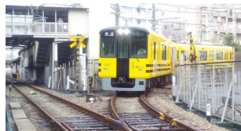
連絡線に入るタイガース号