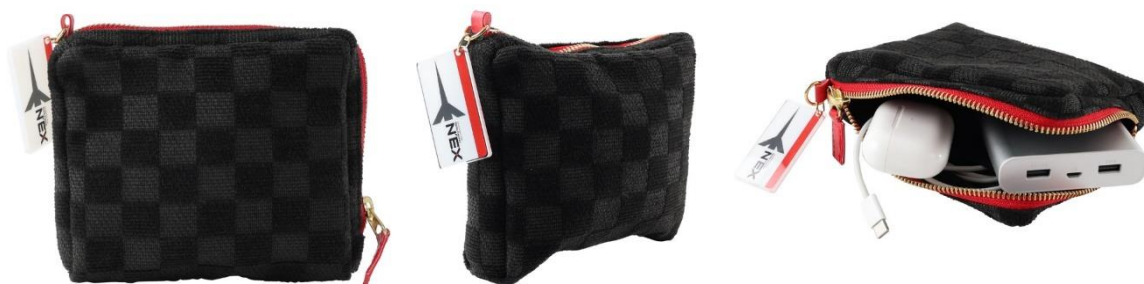
「成田エクスプレスオリジナルポーチ」(サイズ:横 150×高さ 120×マチ 35(mm))

ご参加の皆さまに、E259 系の座席に使用されている生地でリメイクした、ツアー限定の「成田エクスプレスオリジナルポーチ」を差し上げます。