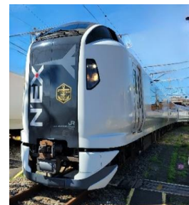
E259 系団体臨時列車 「マリンエクスプレス踊り子」号仕様