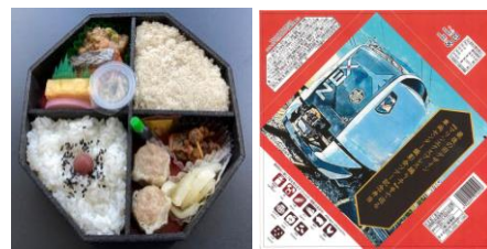
お弁当のイメージ (お弁当・掛け紙) ※JR 東日本商品化許諾済

旧デザインの E259 系 6 両編成を使用した、「マリンエクスプレス踊り子」号仕様の団体臨時列車にご乗車いただけます。先頭車両には、ヘッドマークシールを貼付するほか、車内も「マリンエクスプレス踊り子」号の装飾を施します。座席は窓側の座席(通路側は空席)の確約となり、ゆったりとご乗車いただけます。また、車内では、オリジナル掛け紙付きのお弁当をお召し上がりいただけます。