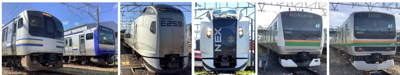
E217 系(手前)と E235 系(奥)