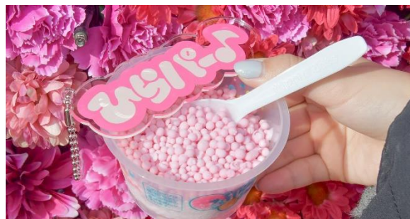
推しカラーのアイスと推しカラーのグッズで撮影