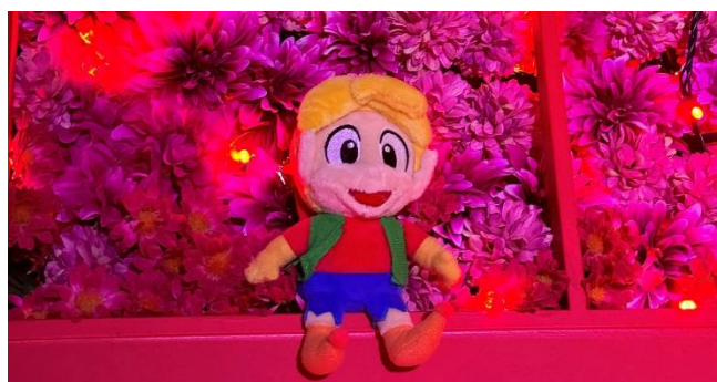
「推し活イルミ」の扉×ぬいぐるみ