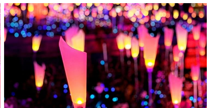
「花占いの泉」にある光の花