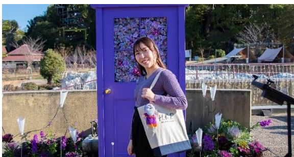
推しカラーの服を身にまどって推しカラーのフォトスポットで撮影