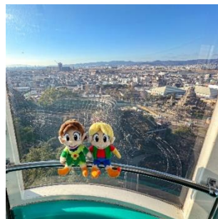
観覧車「スカイウォーカー」×ぬいぐるみ