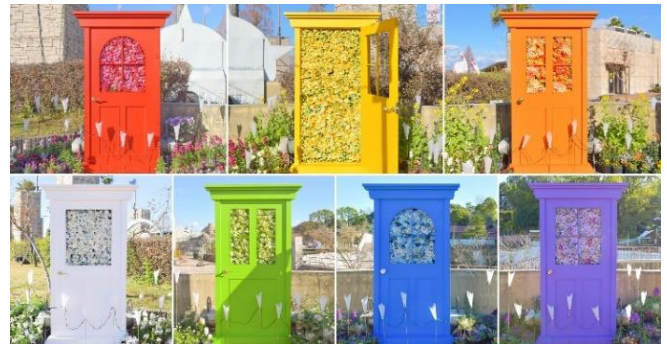
「推し活エリア」の各扉の正面