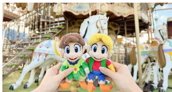
推しと一緒に遊園地を楽しんでいるようにアトラクションを背景に撮影