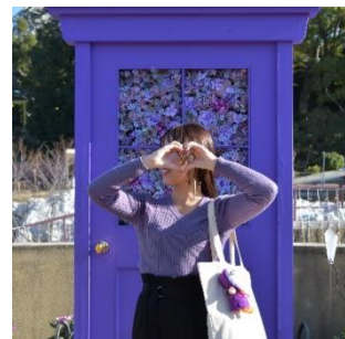
「推し活エリア」扉のフォトスポット