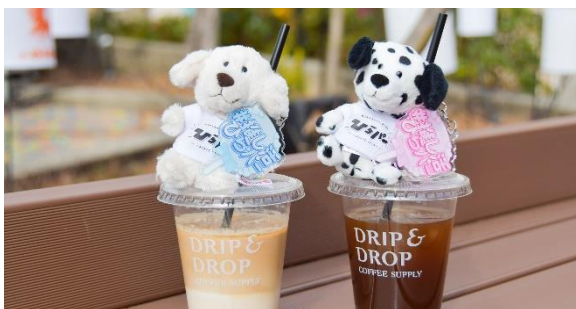
おしゃれなドリンクカップと推しカラーのグッズで撮影