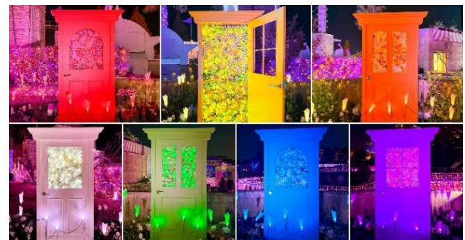
「推し活イルミ」の各扉の正面