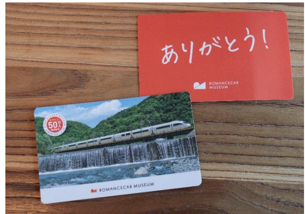
オリジナルロマンスカーカード

12 月 20 日から、先着 5,000 名のお客さまに、オリジナルロマンスカーカード（全 5 種）をプレゼントします（なくなり次第、終了）。このカードは、来館者数 50 万人達成の記念に製作した 5,000 枚限定のオリジナルカードであり、現役ロマンスカー 4 車種に加え、12 月 10 日に完全引退した V S E をモチーフに、5 デザインともに全てにキラキラ光るホログラム加工を施しています。