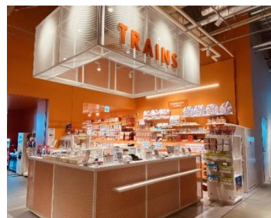
ミュージアムショップ「TRA IN S」