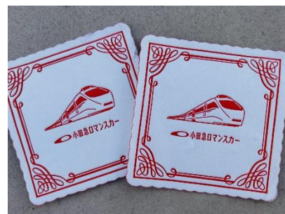
V S Eオリジナルコースター