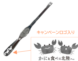
かにフォーク(イメージ)

ご乗車いただいたお客さま全員に「オリジナルかにフォーク」を車内でプレゼントします。