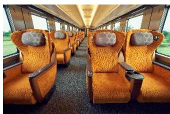
△プレミアムシート