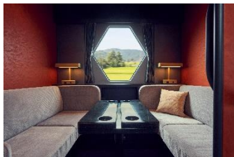
△コンパートメント