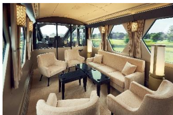
△コックピットスイート

現行のスペーシアを継承しながらもより上質な空間となった個室をはじめ、全6種類のシートの中からお客様それぞれの旅行スタイルに合うものを選んでいただけます。