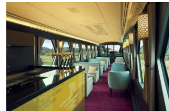
△コックピットラウンジ