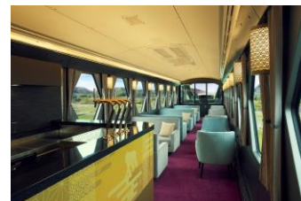
△コックピットラウンジ