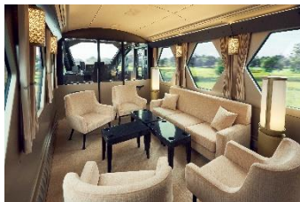
△コックピットスイート

なお、運賃、特急料金（スタンダードシート・プレミアムシート）およびボックスシートの特別座席料金改定はありません。