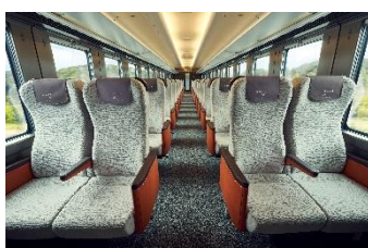
△スタンダードシート