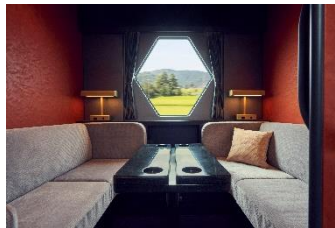
△コンパートメント