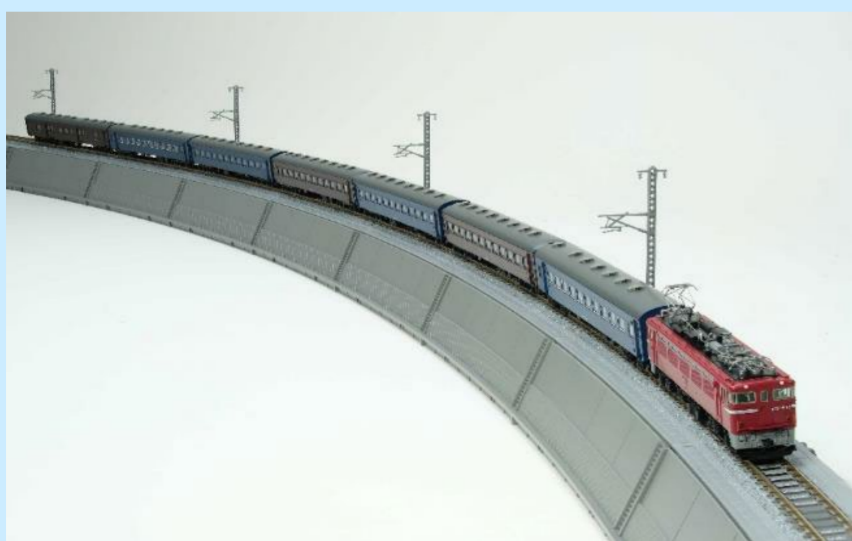
旧型客車をけん引！ 長距離普通列車