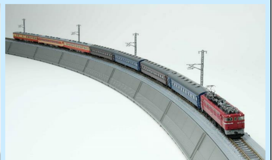
盛岡地区名物！ 旧型客車+ディーゼルカー併結列車