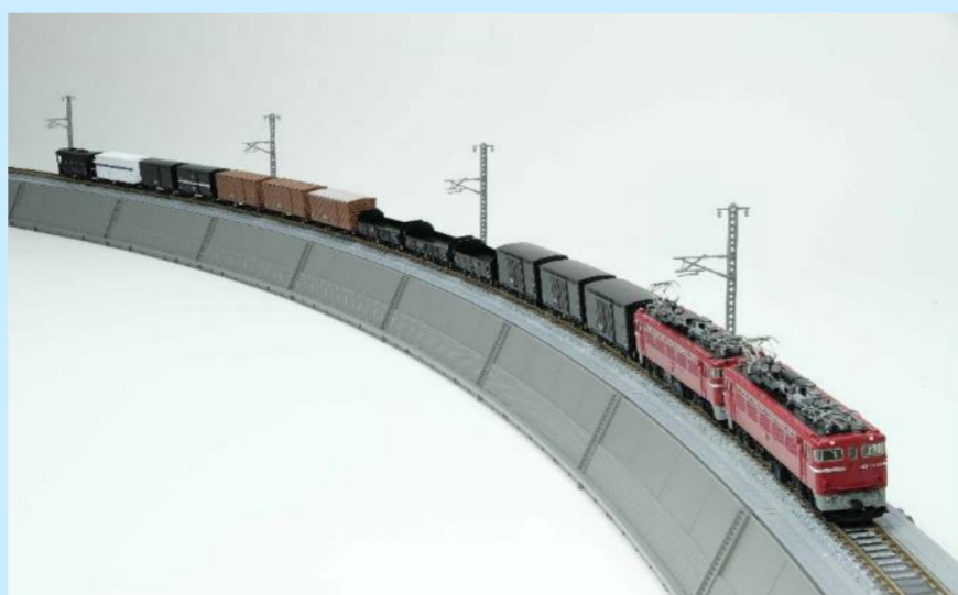
重連でけん引！ 貨物列車