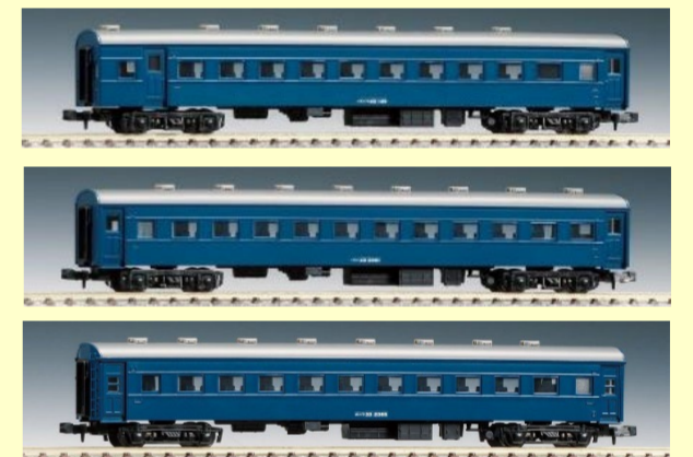
旅情の鈍行列車 旧型客車 各種