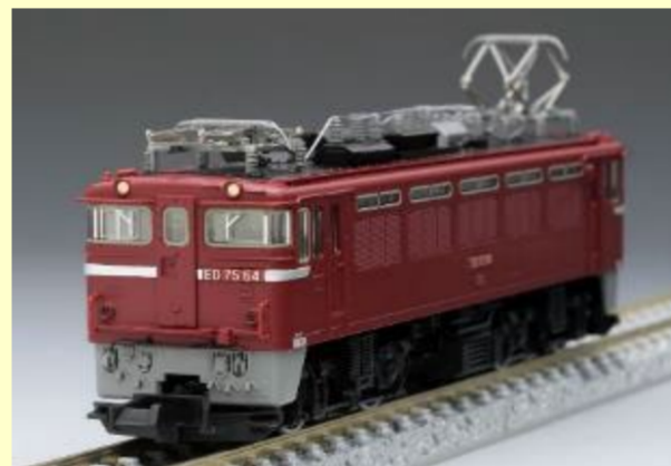
形態違いの重連 ED75形 各種