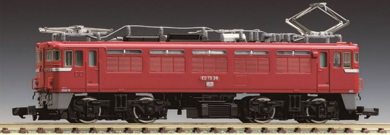
※写真は旧製品です 実際の製品仕様と異なる場合があります