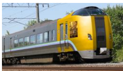
ラッピングのイメージ