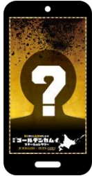
オリジナルコーラボ待ち受け画像