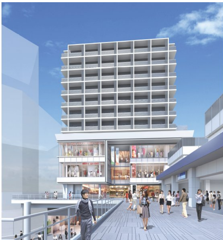
ペDESTリアンデッキから見た 「(仮称)小田急海老名駅東口ビル」イメージ