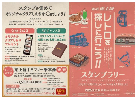
スタンプ台紙（表面）