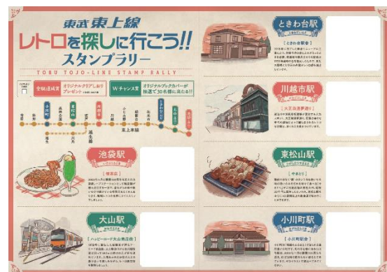
スタンプ台紙（中面）