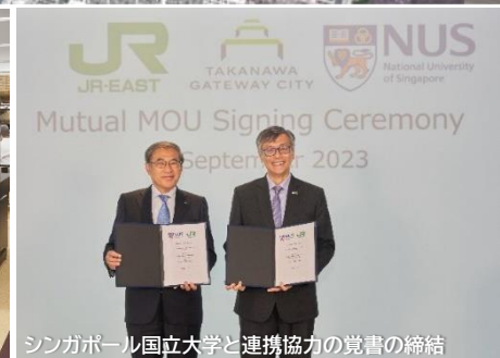
シンガポール国立大学と連携協力の覚書の締結