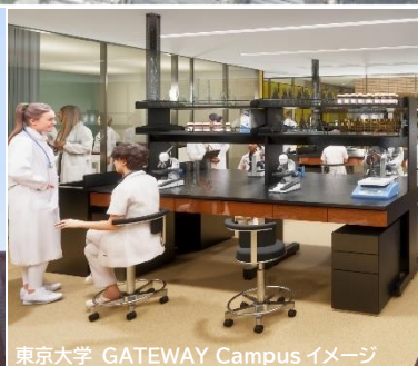
東京大学 GATEWAY Campus イメージ