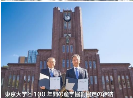
東京大学と100年間の産学協創協定の締結