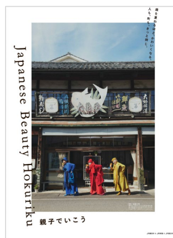
撮影地：福井県（大野市）