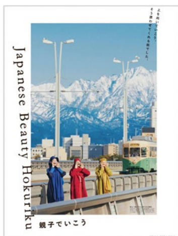
撮影地：富山県（富山市）