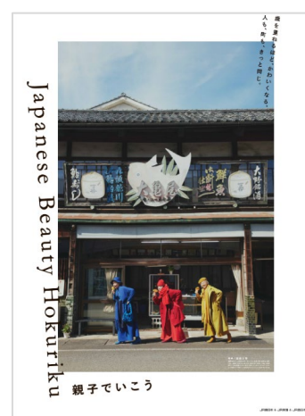
撮影地：福井県（大野市）