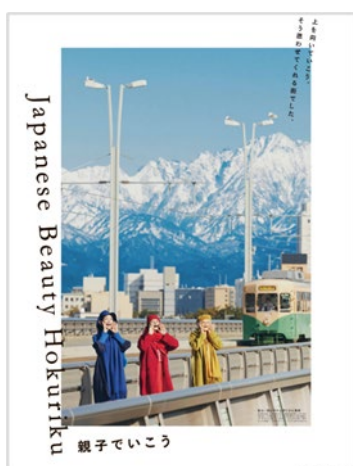
撮影地：富山県（富山市）