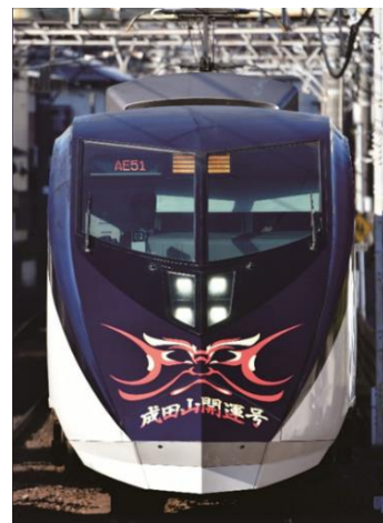
「シティライナー(成田山開運号)」イメージ

なお、2023年12月30日(土)～2024年1月3日(水)の5日間は、土曜・休日ダイヤで運転します。