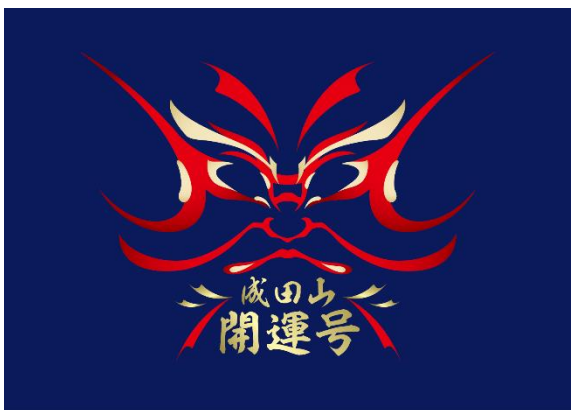
ヘッドマークデザインイメージ

初詣のみならず、都内へのお出かけや鉄道ファンの方等、多くのおお客様のご利用を心よりお待ちしております。