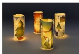
ぬり絵シート・キャンドルの装飾(イメージ)