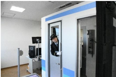
【ドア開閉操作体験】