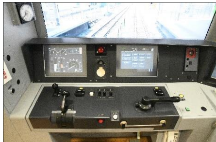
【ツーハンドルの運転台】

*車のアクセルに相当するマスコンとブレーキに相当するハンドルが分かれている運転装置。