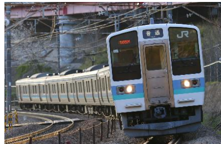
【中央本線を走行する 211 系】 211 系のシミュレータで体験できます