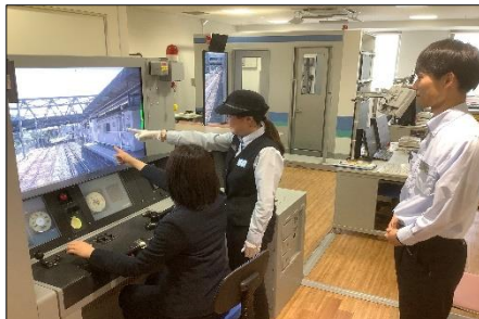
【現役乗務員が付き添いでレクチャー】