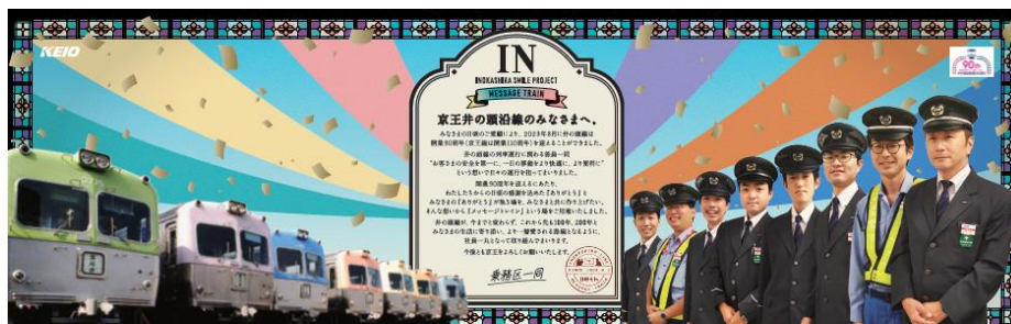
《「メッセージトレイン」掲出ポスターイメージ》