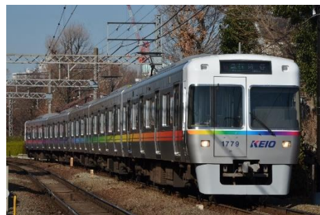
《使用車両イメージ》