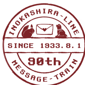
《ヘッドマークイメージ》

渋谷から吉祥寺間を結ぶ井の頭線から連想される動物をイメージしたイラストの間に手紙の封筒を描き、乗務員および皆さまのメッセージを運んでいるデザインにしました。