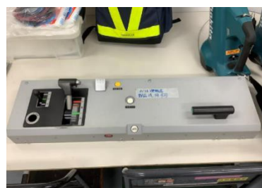
本物の運転台の一部（E233系）