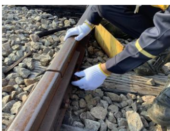
線路メンテナンスの様子