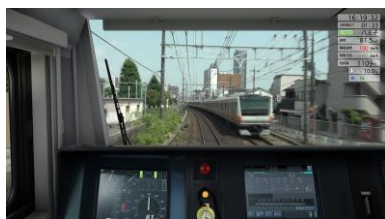
体験画像イメージ