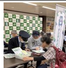
デジタルよろず相談所