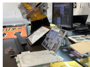
建築メンテナンスのお仕事紹介