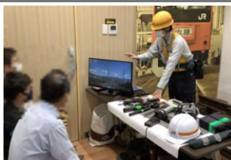
お仕事紹介イメージ