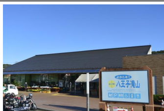
道の駅八王子滝山