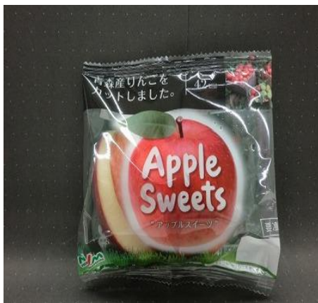
《アップルスウィーツ》