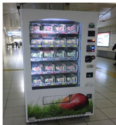
《カットりんご自動販売機イメージ》