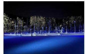
冬の青い池(イメージ)

冬の青い池も、夏とは違った魅力がある幻想的なスポットです。 冬期間（2024年4月30日(火)まで）はライトアップを実施中 です！約10分サイクルで表現される様々な照明パターンによる光 のストーリーをお楽しみください。