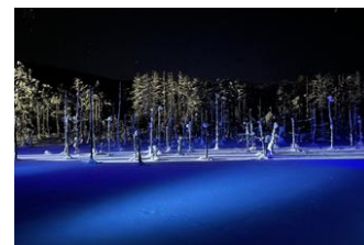
冬の青い池(イメージ)