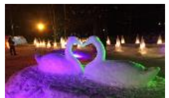
ふらの歓寒村(イメージ)

(開催期間 2023年12月23日(土)～2024年2月29日(木)) 新富良野プリンスホテル内で開催される、冬を満喫するイベント です。オススメは、イス、テーブル、カウンター全てが雪と氷で 作られている「スノーカフェ」。他にも、チュービングすべり台 や、LEDで照らした幻想的な雰囲気味わえる雪華の路（せつ かのみち）などをお楽しみいただけます。