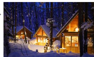
冬のニングルテラス(イメージ)