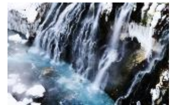
冬の白ひげの滝(イメージ)

美瑛川がしぶきを上げている様子を間近に見ることができます。 白ひげの滝は通年ライトアップを行っておりますが、冬になると、 滝筋と雪の白、岩肌のコントラストが際立ち、滝から上がる 水しぶきや湯気による幻想的な樹氷をお楽しみいただけます。