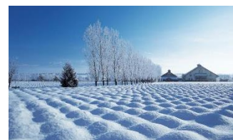
冬のファーム富田(イメージ)

霧氷が付いたポプラ並木や樹氷の木々、キラキラと舞い落ちる雪の結晶といった白銀の景色はもちろん、ラベンダー製品の販売、冬のグリーンハウスでのラベンダー、ドライフラワー展示、写真館、カフェでのソフトクリームや温かいお飲み物などをお楽しみいただけます。