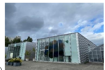
美瑛選果(イメージ)

美瑛産の野菜や、野菜の加工品等、美味しさを体験できる直売 所で、小麦工場のパンなども店内にて販売します。