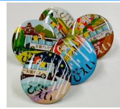
オリジナルピンバッジ (イメージ)

※バス乗車前の受付時に「ふらの・びえいフリーきっぷ」をご提示ください。 ※デザインは選ぶことはできませんので、予めご了承ください。