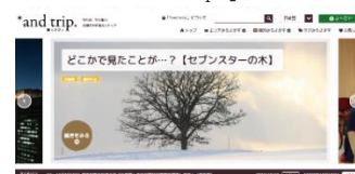
「*and trip.」トップページ(イメージ)

・上記の「*and trip.」に掲載されている富良野・美瑛をはじめとした観光地へのご旅行は、北海道内の列車+宿をセットでおトクに予約ができるWeb限定旅行商品「JR東日本びゅうダイナミックレールパック」が便利です。