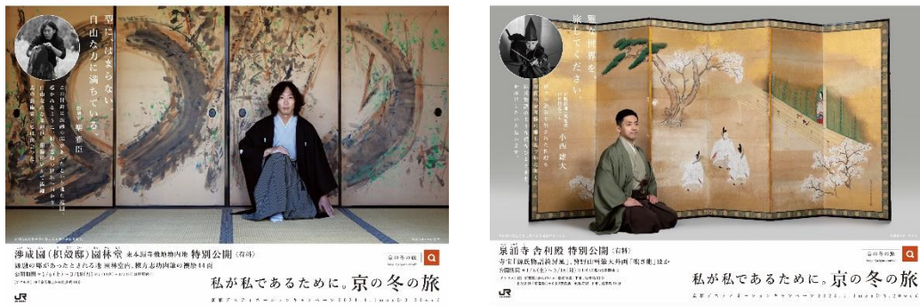
JRグループの主な駅・車内で展開するポスターの一例 ※画像はイメージです

＜京都デスティネーションキャンペーン「第58回京の冬の旅」JRグループポスター＞