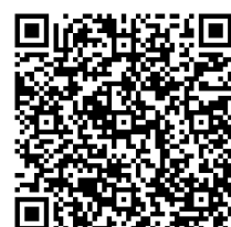
▲専用 WEB ページはこちら