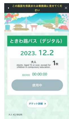
▲チケット画面(イメージ)

※ときわ路パス(デジタル)の購入・利用には「ひたちのくに紀行」サイトへの 会員登録およびモバイル Suica の会員登録が必要です。