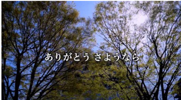
さよなら中野サンプラザクロージングムービー（リンクは以下の通り）

今後も事業者が立ち上げるエリアマネジメント協議会が事務局となり、中野独自の多様な文化と地元の声を活かして、地域の活性化につながる様々な活動を展開し、竣工後は、エリアマネジメント施設と屋上広場の一体的な運用を図り、文化・地域交流を促進することを目指します。