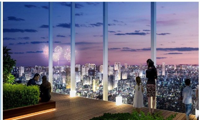
展望施設イメージバース (今後変更になる可能性があります)