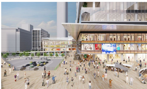
デッキイメージバース (今後変更になる可能性があります)

中野駅から周辺地区へのアクセス動線となる歩行者デッキや、地上と歩行者デッキをつなぐ立体的なアトリウム空間を整備し、中野駅周辺の各地区とバリアフリーでつながる立体的な歩行者ネットワークの形成を図ります。また、建物内の施設と一体的な利用が可能な広場空間の整備により、地域のにぎわいと交流の場を創出するほか、災害時にも避難場所として活用できるよう整備いたします。