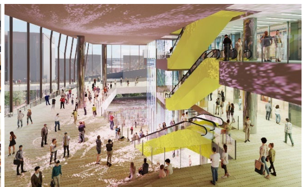
アトリウムイメージバース (今後変更になる可能性があります)