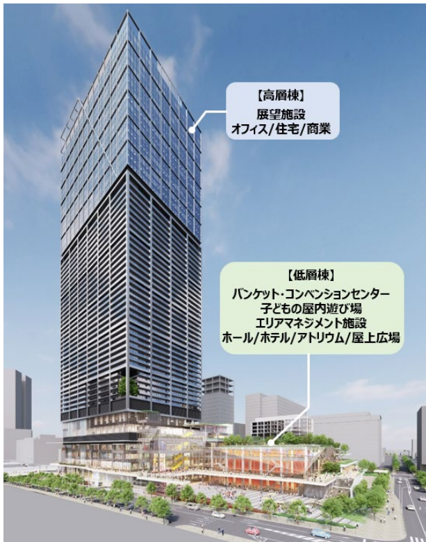
(今後変更になる可能性があります)

中でも交流人口の増加に寄与するための施設として、2023年7月2日に閉館した中野サンプラザのDNAの継承・発展のため、新たな「文化の聖地」として臨場感や一体感が感じられる、最大7,000人規模の「多目的ホール」を整備します。また、中野サンプラザの宴会場や最上階レストランなどが交流の場として様々なシーンを作ってきたことから、ハレの日使いもできる展望レストランや東京西郊、唯一無二の眺望を楽しむことができる屋外テラスを有する「展望施設」、区民や企業などの交流・会合の場として利用できる「バンケット・コンベンションセンター」を導入します。また子育て世代が安心・安全に利用できる「子どもの屋内遊び場」なども整備し、複合型子育て支援機能の導入を図ります。