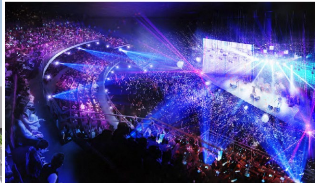
多目的ホールイメージバース (今後変更になる可能性があります)