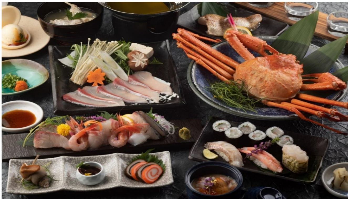
【富山の“美”を心ゆくまで堪能 1泊2食付 宿泊プラン】夕食イメージ

本プランはJR グループが共同で2024年10月～12月に開催する「北陸デスティネーションキャンペーン」※を見据えて開催される「Japanese Beauty Hokuriku キャンペーン」のテーマである5つの「 美 」を体感いただけるプランとして期間限定で販売いたします。