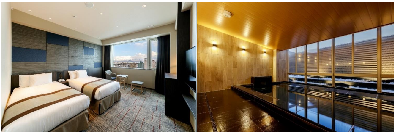
左：デラックスツインプラス 右：大浴場 ※画像はイメージ