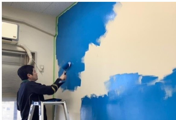
▲駅社員によるリノベーション作業の様子