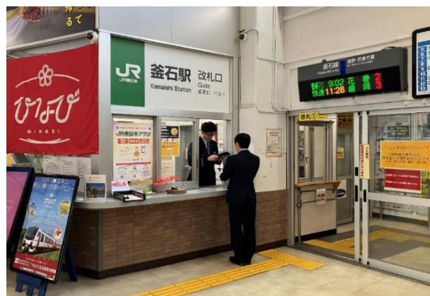
▲コワーキング利用の手続きの様子