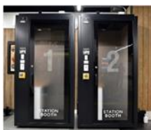
▲ STATION BOOTH