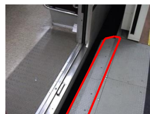
可動ステップ：赤枠部分がホームドアの開閉に連動してスライドし隙間を埋める。

さらに、曲線ホーム区間でホームと車両の隙間が大きい箇所がある駅には、当該箇所に可動ステップも取り付け、より一層の安全性向上に努めています。