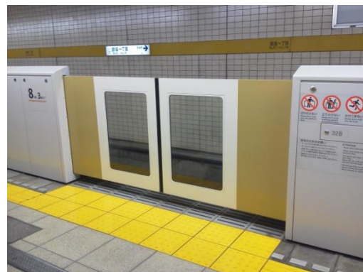
平成 24 年 4 月 14 日から使用開始された銀座一丁目駅のホームドア

東京メトロでは、引き続き、平成 25 年度中の完成を目指して、有楽町線全駅にホームドアの設置を進めてまいります。工事期間中はお客様に大変ご不便とご迷惑をお掛けしますが、ご理解くださいますようお願いいたします。