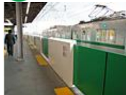
2 駅（綾瀬駅、北綾瀬駅）