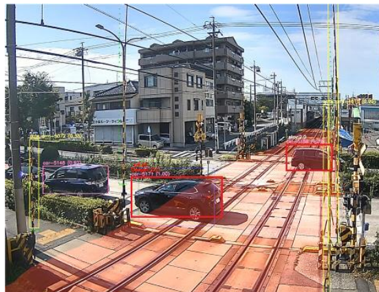
AI 画像解析装置により物体を検知している様子（イメージ）

このような状況に対して、交通に関わる事業者が互いに協力し、AI 画像解析を活用した事故を未然に防ぐシステムの構築を目指し、踏切の安全性を向上するための仕組みを導入します。